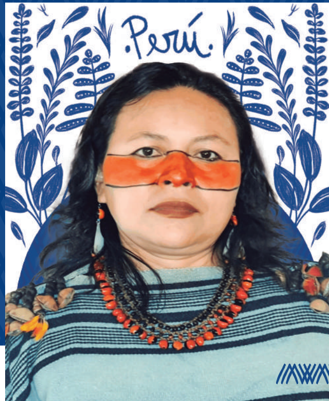
Gráfico 6. Tabela Casique Coronado, Perú

Líder indígena amazónica, actualmente ejerce el cargo de dirigente de Educación, Ciencia y Tecnología, coordinadora de las Organizaciones Indígenas de la Cuenca Amazónica (COICA) Líder de mujeres Indígenas Asheninka, miembro del Consejo Directivo de AIDSESEP, actualmente como secretaria y responsable del Programa Salud Interculturalidad y Cambio Climático.