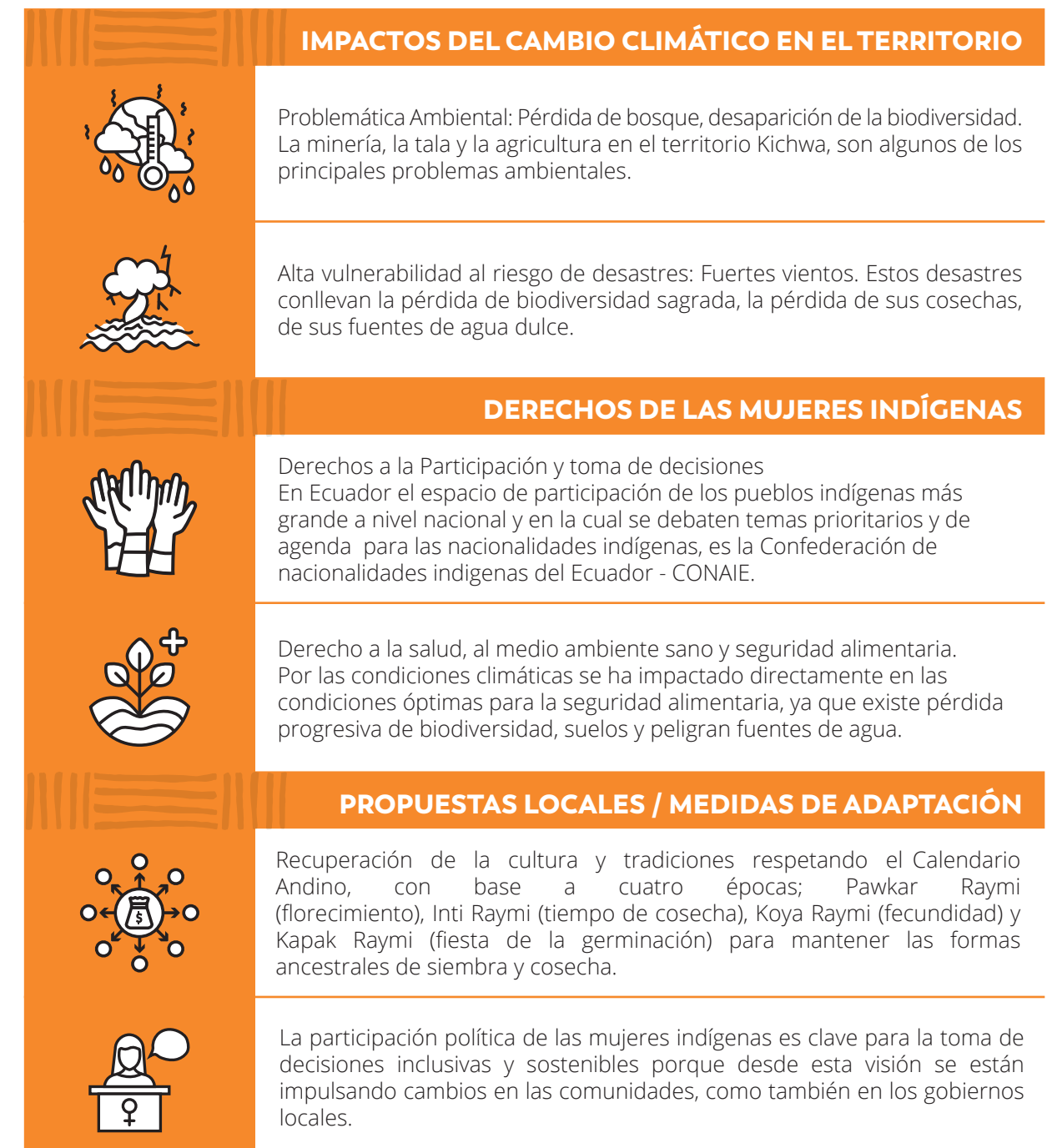
TABLA 2. IMPACTOS DEL CAMBIO CLIMÁTICO Y RELACIÓN CON LOS DERECHOS DE LAS MUJERES INDÍGENAS EN ECUADOR