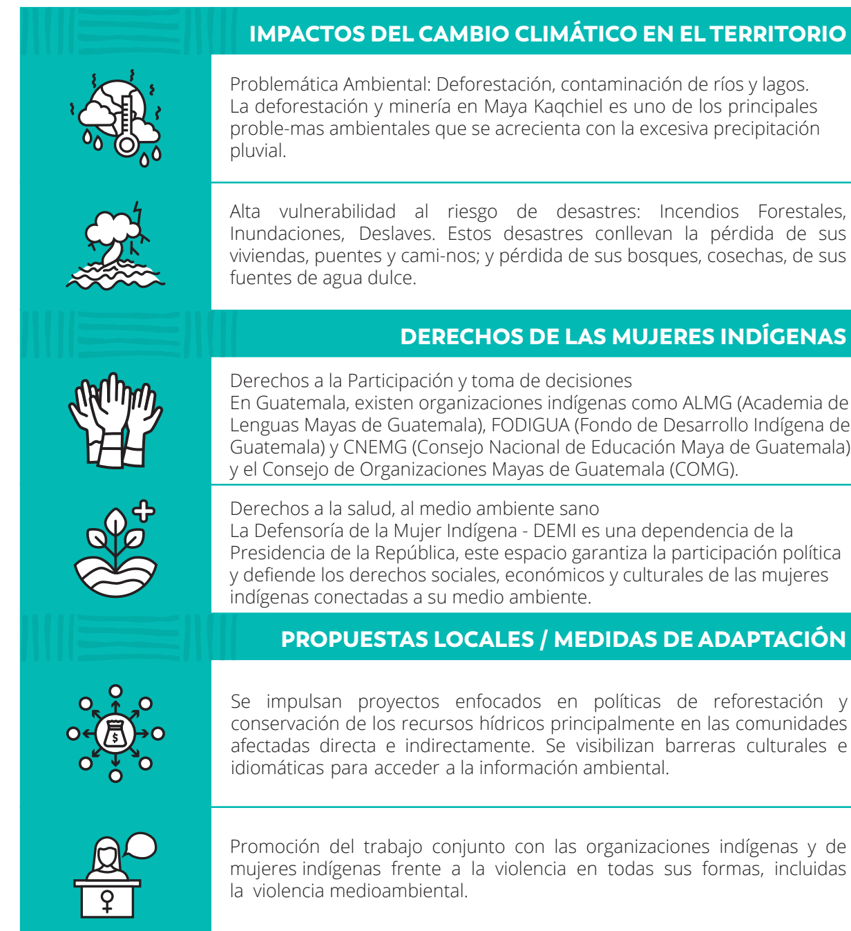
TABLA 5. IMPACTOS DEL CAMBIO CLIMÁTICO Y RELACIÓN CON LOS DERECHOS DE LAS MUJERES INDÍGENAS DE GUATEMALA