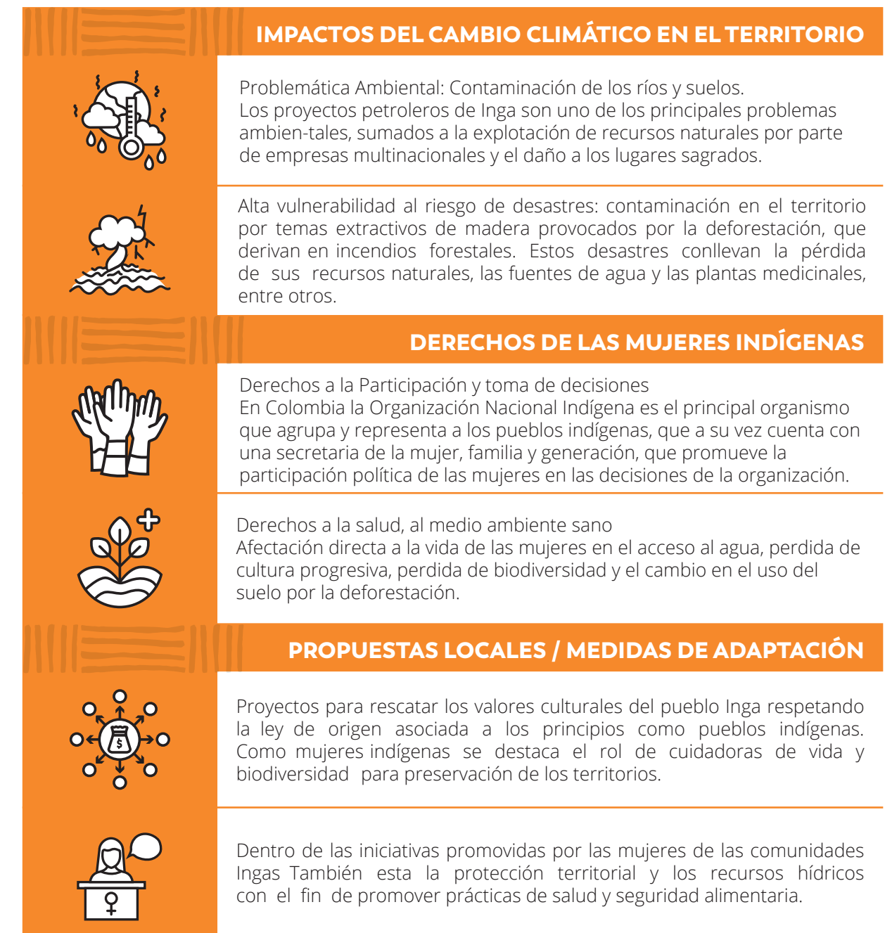
TABLA 6. IMPACTOS DEL CAMBIO CLIMÁTICO Y RELACIÓN CON LOS DERECHOS DE LAS MUJERES INDÍGENAS EN COLOMBIA