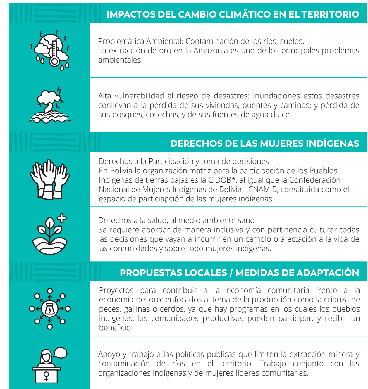
TABLA 1. IMPACTOS DEL CAMBIO CLIMÁTICO Y RELACIÓN CON LOS DERECHOS DE LAS MUJERES INDÍGENAS EN BOLIVIA