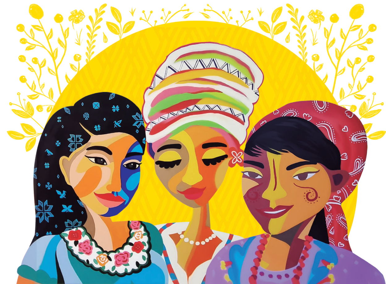
Gráfico 2. Representación de Mujeres indígenas

Es importante destacar que en América Latina se ha incrementado la participación de las mujeres indígenas en diversos espacios de tomas de decisión en las políticas públicas y globales. (CEPAL, 2023, pág. 3)