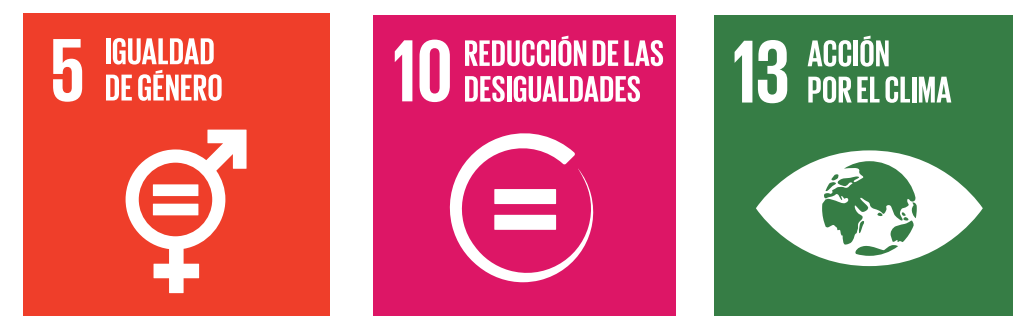
Gráfico 1. ODS e Igualdad de Género

En este entendido, CEPAL identificó cuatro nudos estructurales que deben enfrentar todos los Estados de América Latina y El Caribe para avanzar en igualdad de género dentro del marco de la Agenda de Desarrollo Sostenible (ODS), que incorpora la problemática del cambio climático, vinculando el ODS 5: Igualdad de género con el ODS 10: Reducción de las desigualdades y el Objetivo de Desarrollo Sostenible 13: Acción por el Clima. (CEPAL, 2022)