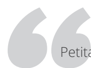
Gráfico 9. Petita Ayarza Perez, Panamá

Petita transmite un mensaje de empoderamiento: