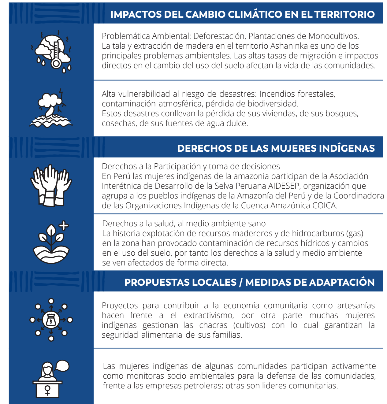
TABLA 4. IMPACTOS DEL CAMBIO CLIMÁTICO Y RELACIÓN CON LOS DERECHOS DE LAS MUJERES INDÍGENAS EN PERÚ