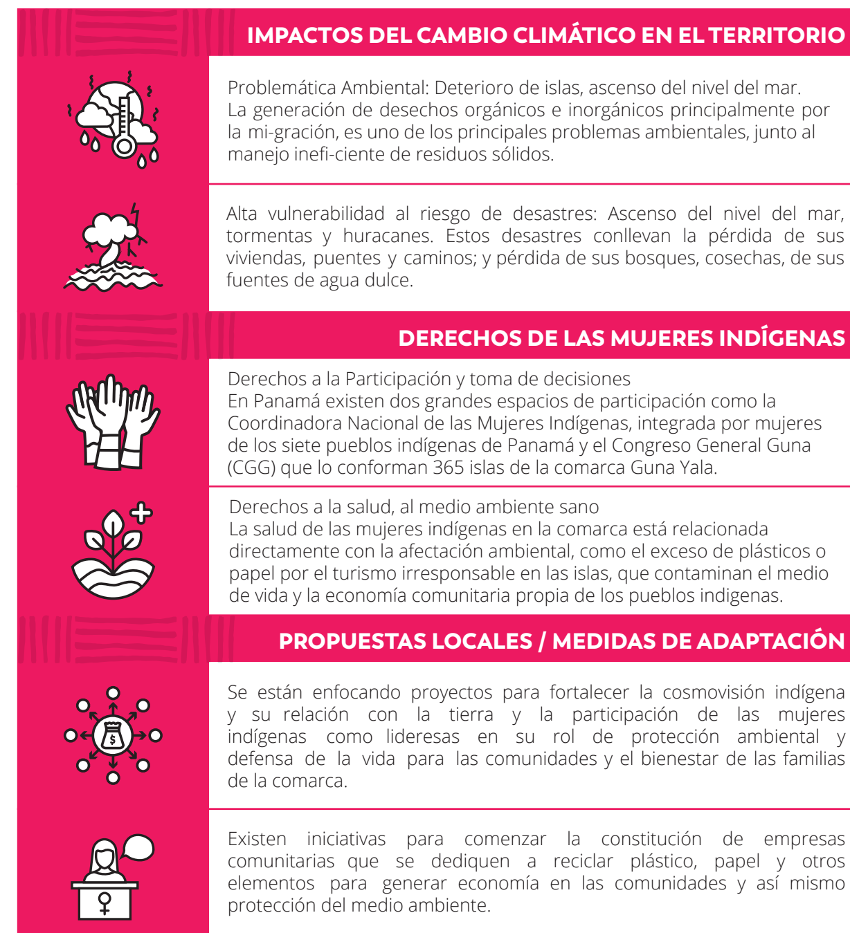
TABLA 7. IMPACTOS DEL CAMBIO CLIMÁTICO Y RELACIÓN CON LOS DERECHOS DE LAS MUJERES INDÍGENAS DE PANAMÁ